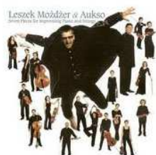
Leszek Możdżer & Aukso (2004)