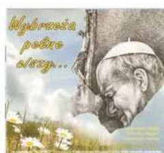
Wybrzeża pełne ciszy... (2007)