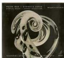
AUKSO współcześnie (2003)