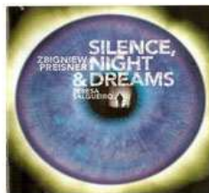
Zbigniew Preisner - Silence, night & dreams (2007)