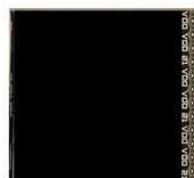
VOO VOO 21 (2006)