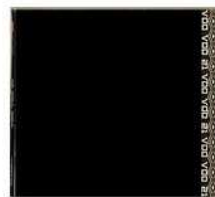
VOO VOO 21 (2006)