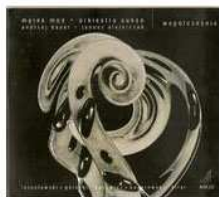
AUKSO współcześnie (2003)