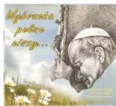
Wyrzeża pełne ciszy... (2007)