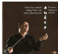
Bacewicz Penderecki Kancheli (2008)