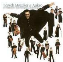
Leszek Możdżer & Aukso (2004)